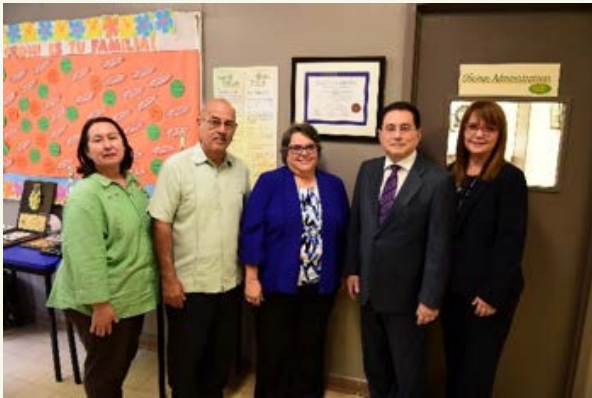
Acreditación de Middle States Association, 2016