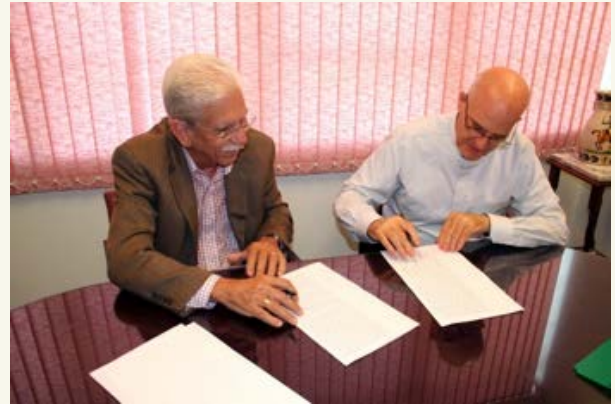
Compraventa de instalaciones CeDIn Elemental, 2010

Han sido casi 10 años llenos de retos continuos y de grandes satisfacciones. En CeDIn reafirmamos la educación con principios humanistas en donde se reconoce la importancia de la diversidad y se fomenta un currículo holístico que busca atemperarse a los cambios continuos de la sociedad. Estamos listos para enfrentar con alegría y esperanza los próximos 10 años de historia.