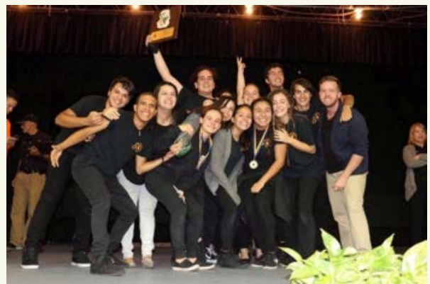
CeDIn se unió a la Liga de Oratoria en Español de Puerto Rico en el año 2014 ganando primer lugar por tres años consecutivos.

CeDIn fue uno muy satisfactorio que nunca podré olvidar pues en esta institución fue en la que me formé para ser la persona que soy hoy en día. Una de las enseñanzas más valiosas que me llevé de los maestros, enfocada en la cultura de paz y los principios ecuménicos y humanistas: es que sin importar donde me encuentre o qué esté haciendo, siempre trate de ser mejor persona. ¡De que vale mucha inteligencia y poca habilidad para desenvolverme de manera positiva en la sociedad! Volviendo a la cita de Einstein, CeDIn no busca que el estudiante sea experto en lo que ya está escrito, busca que sea partícipe de continuar escribiendo los próximos capítulos.