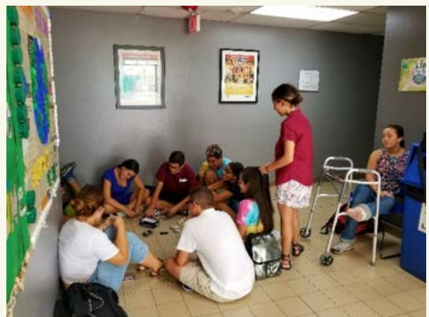
Experiencias de clase después del huracán María, 2016