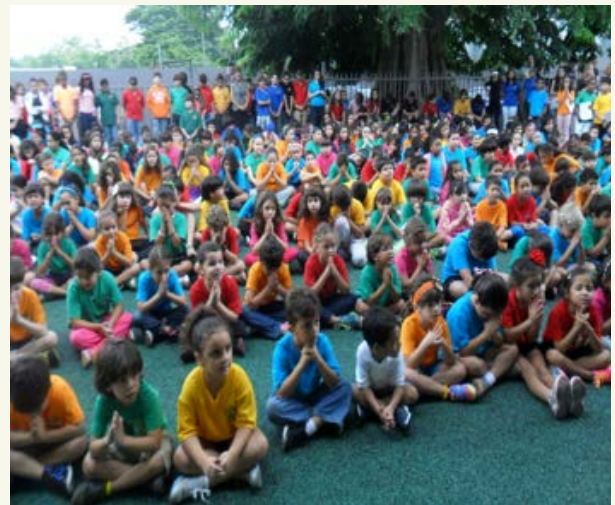
Círculo de la Paz