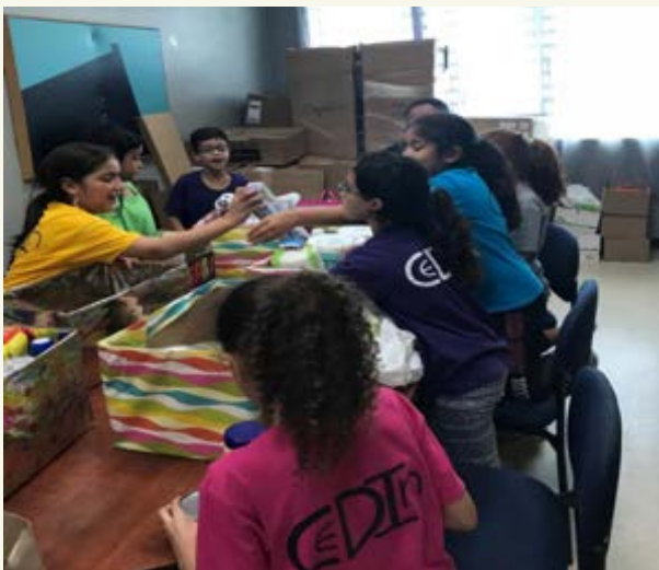
Recogido de artículos Proyecto Gratitude