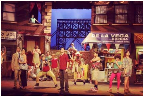
In the Heights, 2016