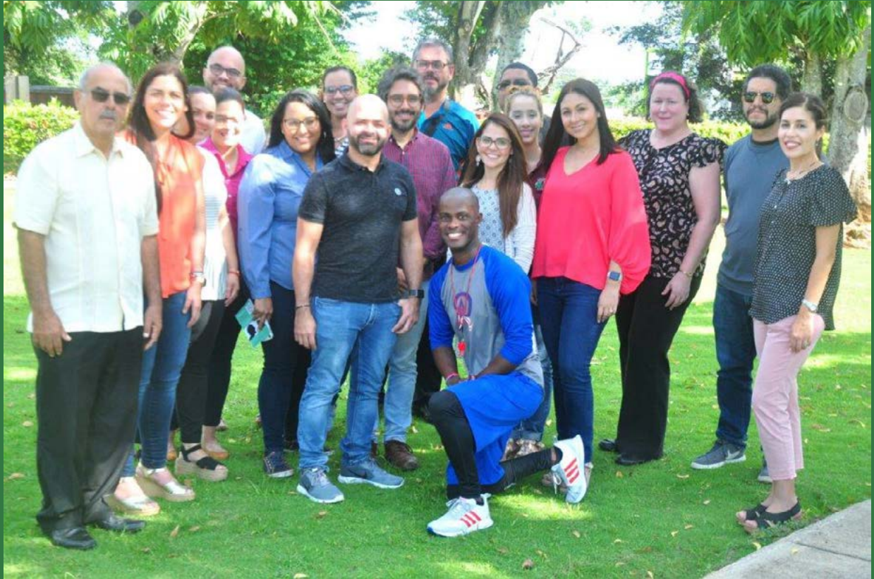
Facultad CeDIn Superior 2019-2020