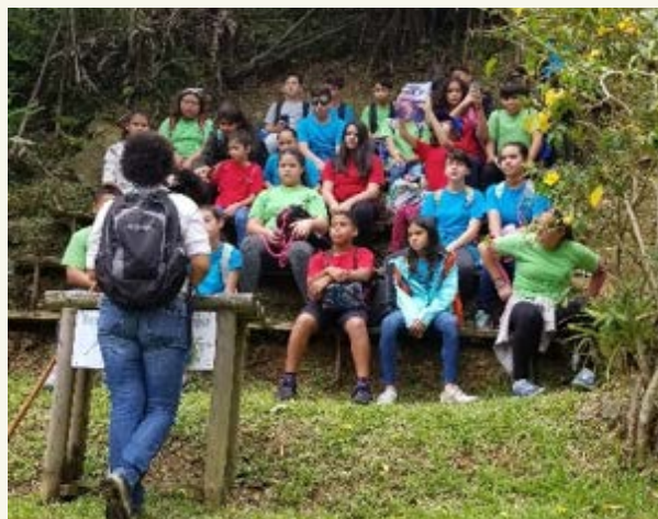
Inmersión en la naturaleza