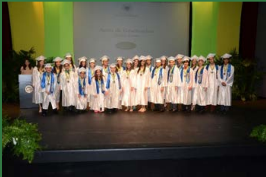
Primera clase graduada de CeDIn Elemental, 2013