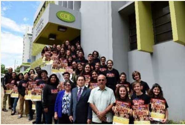
Visita del Presidente a CeDiIn, 2016