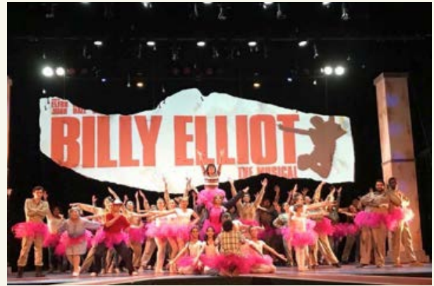
Billy Elliot, 2018