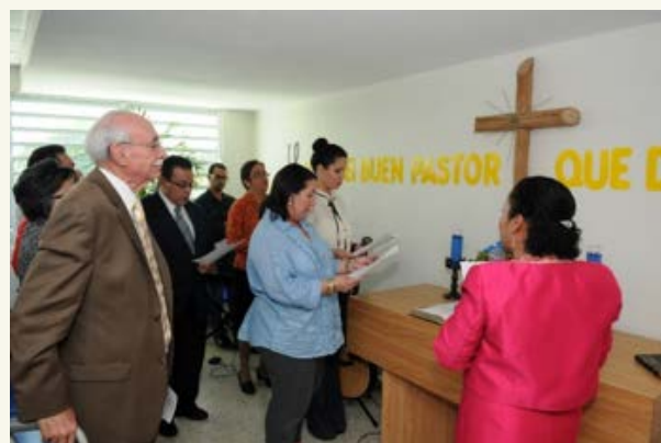
Acto de inauguración de la Capilla CeDIn Elemental, 2012