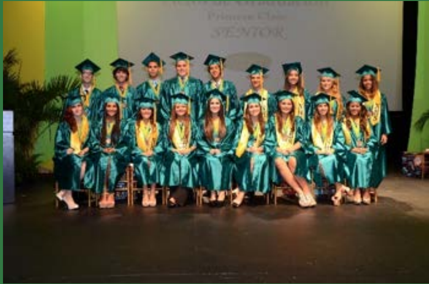
Primera clase graduada de CeDIn Superior, 2013