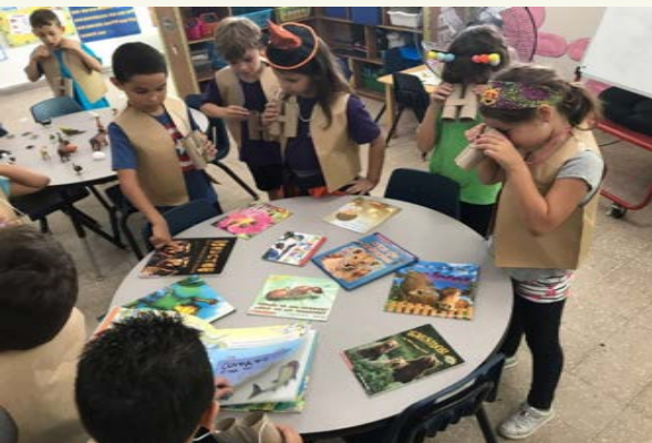
Dramatizando la lectura