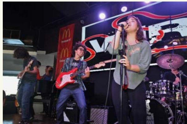
Banda Wired en el Battle of the Bands de la Fundación Ronald McDonald, 2015

con la capacidad de pensar críticamente, con la sensibilidad artística y la alegría de la vida. He visto jóvenes adultos ya graduándose de la universidad y como siguen forjando sueños e impactando vidas para el bien. He visto jóvenes partir con Dios, por situaciones de salud, y como la comunidad escolar abrazó a las familias adoptándolos como parte de sus vidas. He visto jóvenes alzar la voz ante las injusticias y luchar por la paz y el bienestar de nuestro Puerto Rico y el resto del mundo. Jóvenes con conciencia ecológica y con valores a favor de la dignidad humana. Seguimos sembrando, cultivando y cosechando una cultura de paz, llena de mucha música y alegría. CeDIn no es un lugar, sino es la comunidad que compone este lugar. Son los maestros, los estudiantes, los padres y madres, los directores, los asistentes, los administrativos, los de la cafetería, los de mantenimiento, los guardias, TODOS. CeDIn siempre será un pedacito de cielo que inspira a todo el que pase por esta comunidad, a soñar. ¡Por estos diez años y todos los que vendrán!