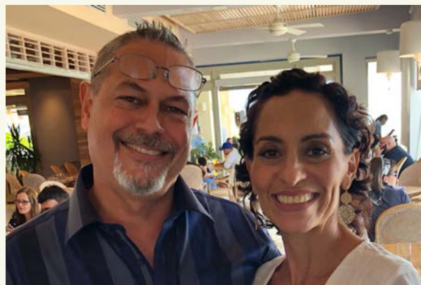
Familia Domínguez Robles

Con todo el cariño y agradecimiento posible,