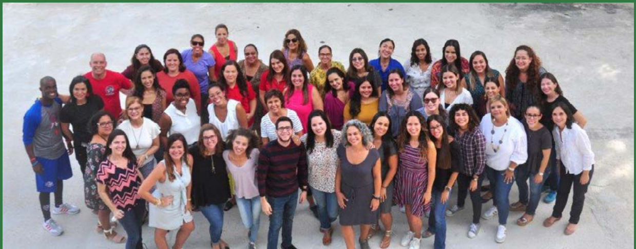
Facultad CeDIn Elemental 2019-2020