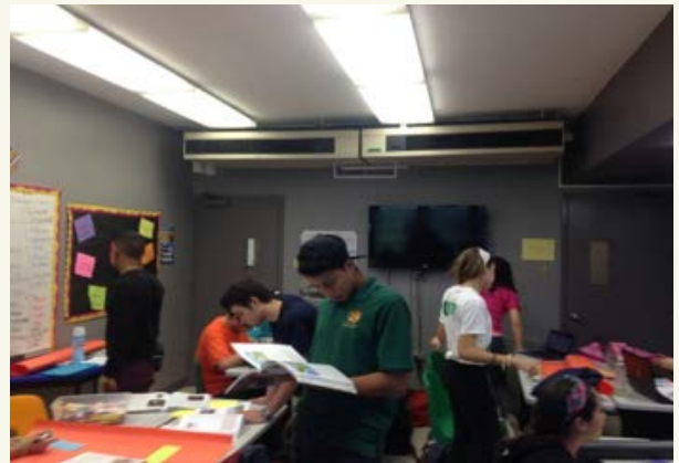
Niños felices aprenden más y mejor