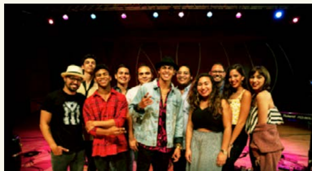
Apolo y Raíces, 2019