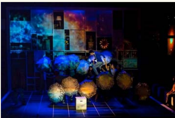
The Curious Incident of the Dog in the Night-Time, 2018