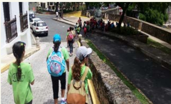
Visita por El Viejo San Juan