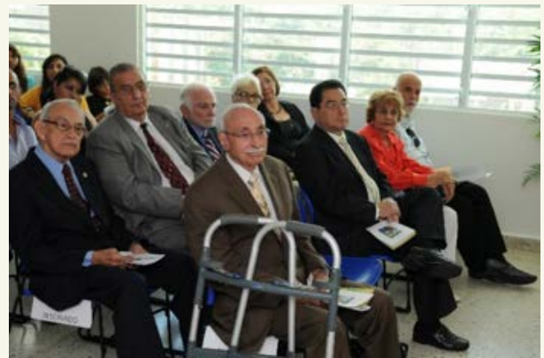
Acto de inauguración de la Capilla CeDIn Elemental, septiembre de 2012