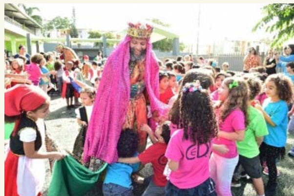
Visita de los Reyes Magos de Juana Díaz, 2016

Ciertamente, CeDIn es lo que declara nuestra canción Mucho más que una escuela, es este lugar, un pedacito de cielo que me inspira a soñar... Durante estos diez años cada estudiante ha sido inspirado para soñar con un mejor país. Con esta firme convicción continuamos sembrando en paz para recoger como fruto la justicia. 2