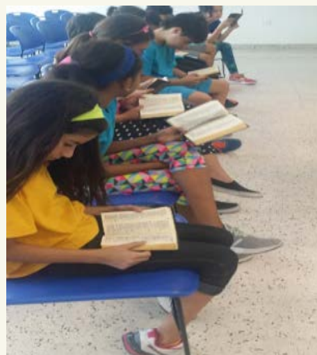
Reflexión con los más pequeños