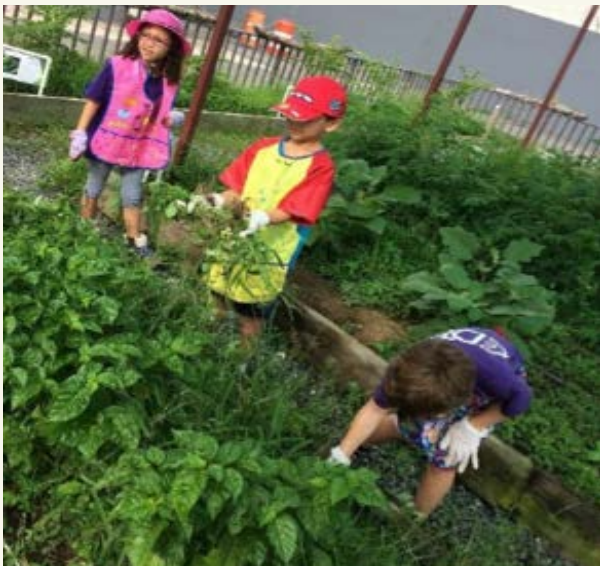
Experiencias en el huerto escolar